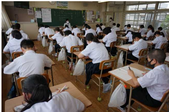
1年生 中学校初めての試験