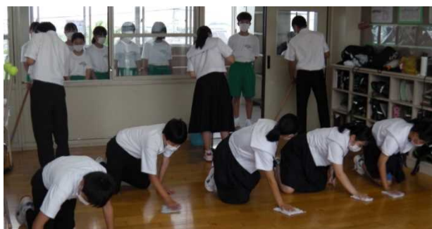
3年生は1年生に黙働掃除を見本として見せます