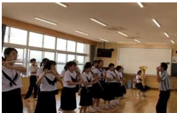
吹奏楽部1年生のためのコンサート