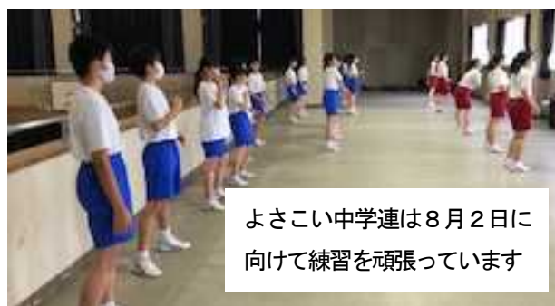
よさこい中学連は8月2日に向けて練習を頑張っています