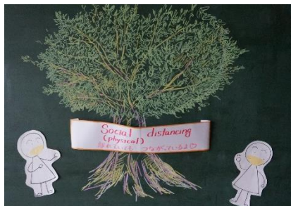
ソーシャルディスタンス