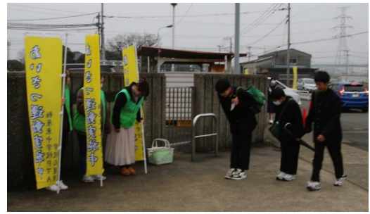
朝のあいさつ運動の様子

ここまで活動が進められているのは、保護者、地域の皆様の温かいご支援とご協力があるからこそと職員一同考えております。今年度も本当に有難うございました。