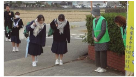
【資料】保護者に挨拶する生徒

役員の皆様とともに、ボランティアで参加いただいた皆様に、心より感謝申し上げます。