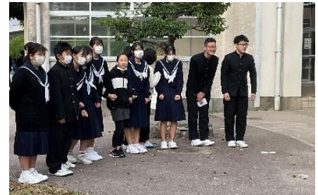
【資料】西小での挨拶運動